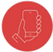
DIGITAL & TECH

L'image du senior scotchés devant sa télévision H 24 à du plomb dans l'aile. Force est de constater que les seniors sont de plus en plus connectés et que l'utilisation d'internet, des réseaux sociaux, des nouvelles technologies n'est plus le domaine réservé des millennials ! Le village DIGITAL ET TECH permettra aux visiteurs de tester des produits innovants et des services mais aussi de trouver des outils pour rester connectés et communiquer avec leurs proches.