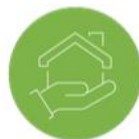
SERVICES À DOMICILE