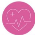
SANTÉ, SPORT & BIEN-ÊTRE