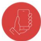
DIGITAL & TECH