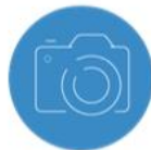
TOURISME & PASSIONS