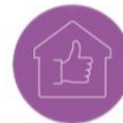
LOGEMENT : SOLUTIONS & ÉQUIPEMENTS