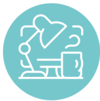
RETRAITE & EMPLOI

Toujours actif ? Seulement 47% des 55-65 ans ont un emploi, nombreux sont donc ceux qui cherchent à rebondir professionnellement et s'ouvrir à d'autres options comme la création d'entreprise ou l'investissement dans une franchise.