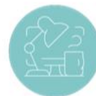
RETRAITE & EMPLOI