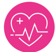
SANTÉ, SPORT & BIEN-ÊTRE

Pour anticiper leurs interrogations et leurs besoins, le Forum des Seniors Atlantique met en place un Parcours Prévention Santé, construit avec le Gérontopole Autonomie Longévité des Pays de la Loire et le Centre de Prévention Agirc-Arrco et animé par des spécialistes, qui comprend quatre temps forts : des conférences plénières, des ateliers à l'Espace Conseil Santé (en partenariat avec Harmonie Mutuelle), des exercices physiques (remise en forme, marche nordique, etc.) et un Espace de dépistages (tension, troubles de l'audition et de la vue, glycémie...). Qu'attendent les visiteurs ? Avoir des échanges qualifiés avec les exposants-santé, trouver de bons conseils, rencontrer leur mutuelle et découvrir une diversité d'approches thérapeutiques, comme l'aromathérapie ou l'autohypnose. Le Forum met aussi l'accent sur la prévention et le bien-être en proposant les services de thalassos et des offres d'activités sportives à faire dans la région, adaptées aux seniors, ludiques et qui permettent de rester en forme !