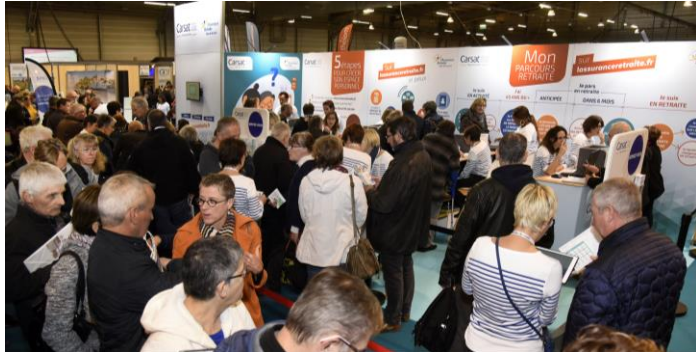
Espace Conseil Retraite