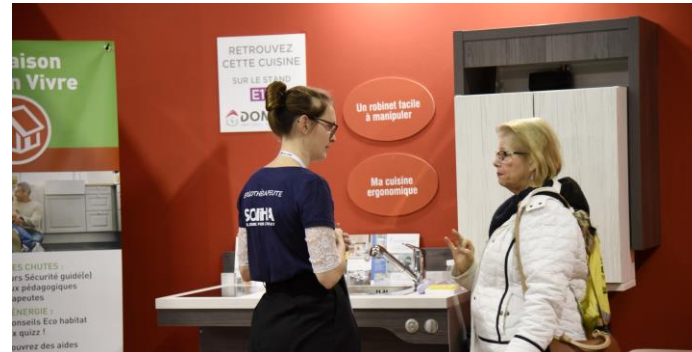
Maison du Bien Vivre