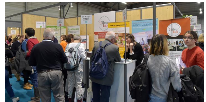
Start-up sur le Silver Lab