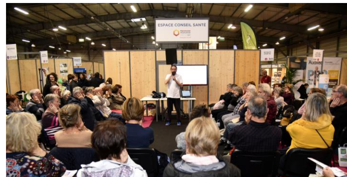
Espace Conseil Santé